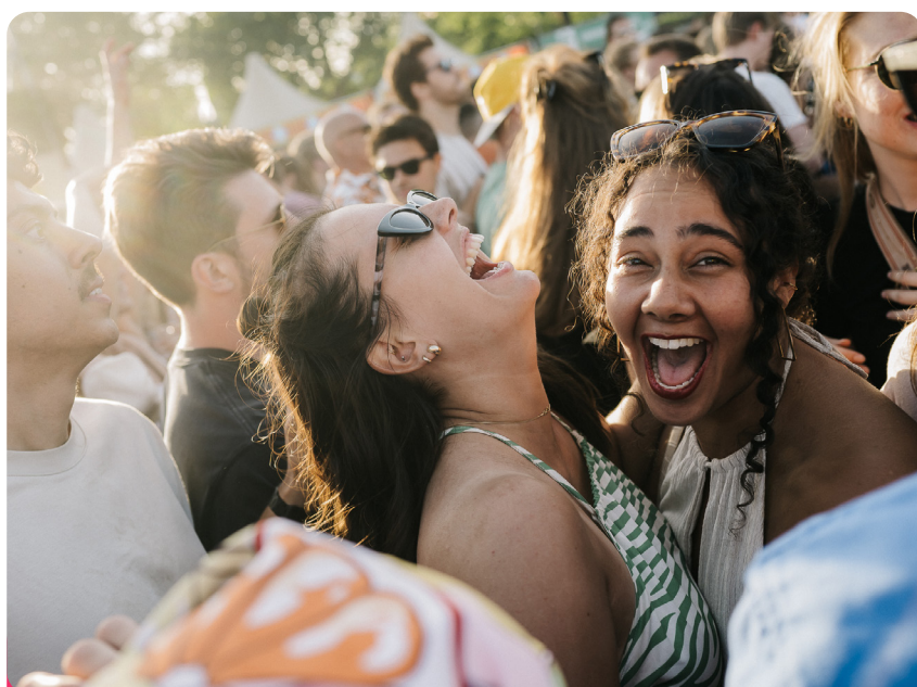
Blijdorp Festival